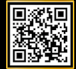
단체 문의 바로 가기