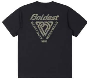
*후면 이미지 BKW