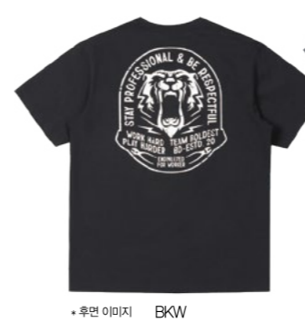
*후면 이미지 BKW