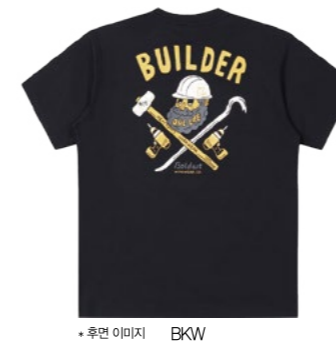
*후면 이미지 BKW