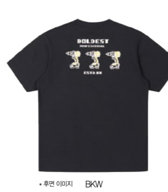
*후면 이미지 BKW